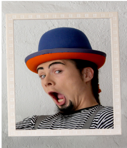
CLOWN Y MIMO