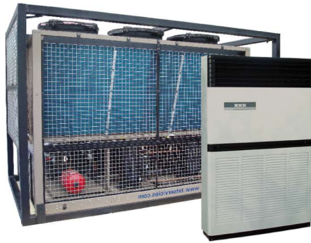
Enfriadoras de agua con bomba de calor de 65 a 1.000KW.