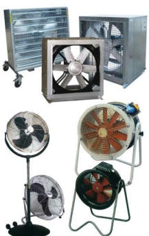
Cajas de ventilación para insonorizadas. Ventiladores portátiles.