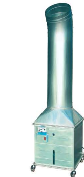
Aromatisador para medianos y grandes volúmenes.