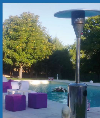
Estufas de jardín