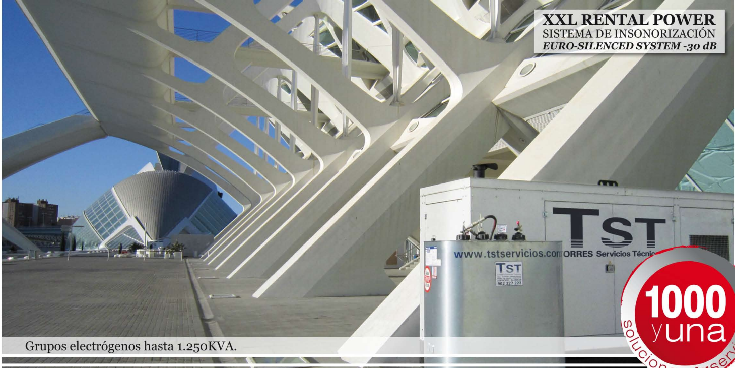
Grupos electrógenos hasta 1.250KVA.