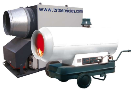
Generadores de aire caliente de 50, 70 y 80KW.