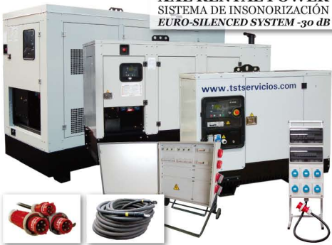
Grupos electrógenos desde 5 a 1.250KVA. Cuadros eléctricos y cableado de todo tipo.