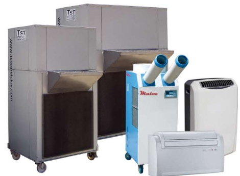
Aire acondicionado con bomba de calor desde 2 a 100KW aire-aire.