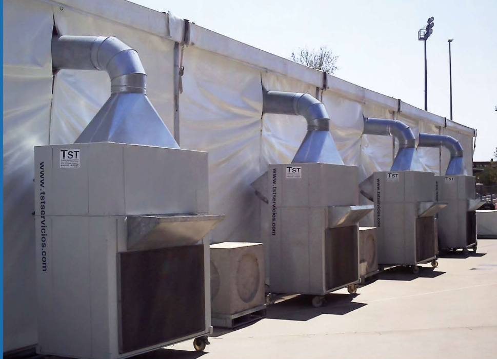
Climatización de grandes volúmenes