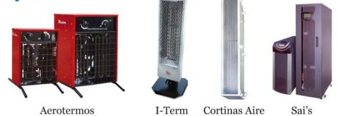
Aerotermos I-Term Cortinas Aire Sai's