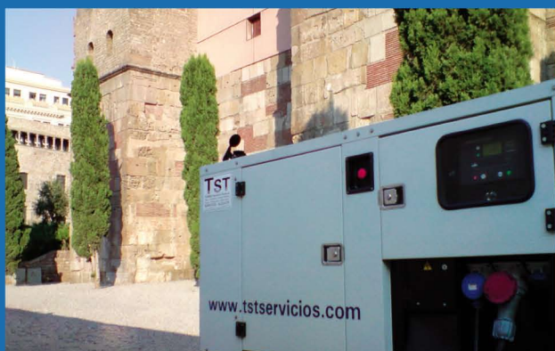
Grupos electrógenos super silenciados