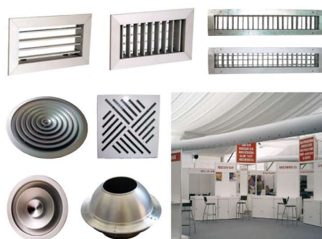
Diseño rejillas a la carta Disponemos de diferentes soluciones técnicas y estéticas para la distribución de la climatización.