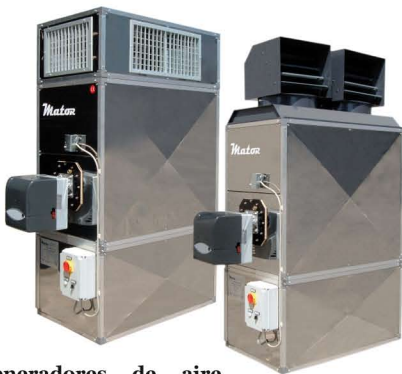
Generadores de aire caliente a gasoil de 150 y 400KW.