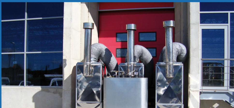
Generadores de aire caliente para grandes volúmenes