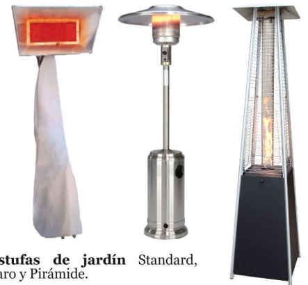
Estufas de jardín Standard, Faro y Pirámide.